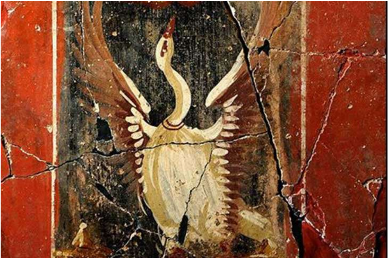
Casa de la Fortuna