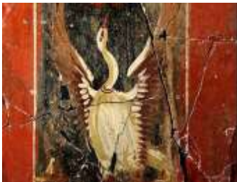
Casa de la Fortuna